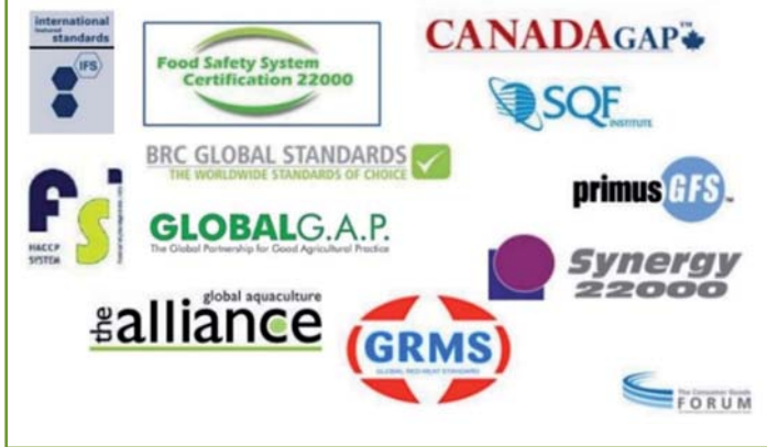
GRÁFICO 1 - Esquemas reconocidos por GFSI

Para poder certificar algunas de las normas de GFSI, se deben tener en cuenta y cumplir una serie de prerrequisitos o programas de requisitos previos dentro de los procesos de fabricación. Estos prerrequisitos incluyen la revisión, la mejora y el funcionamiento óptimo de: